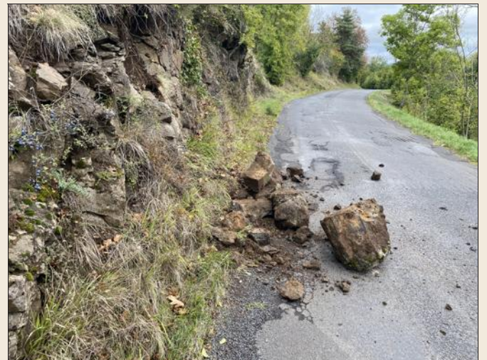
Les gros rochers ont été rapidement évacués par les agents du centre technique.

Attention, toutefois : si vous empruntez cet axe de circulation, la météo humide de ces dernières semaines fragilise grandement la paroi rocheuse. Par conséquent, le risque de chutes de pierres est important dans ce secteur où beaucoup de petits éboulements se produisent en cours d'année.